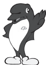
千葉県警察マスコットキャラクター 「シーポック」