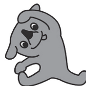
千葉県マスコットキャラクター 「チーバくん」