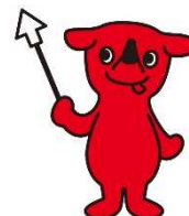
千葉県マスコットキャラクター 「チーバくん」

受給券が必要となるため、あらかじめ 市町村窓口で受給券の交付申請を 行ってください。