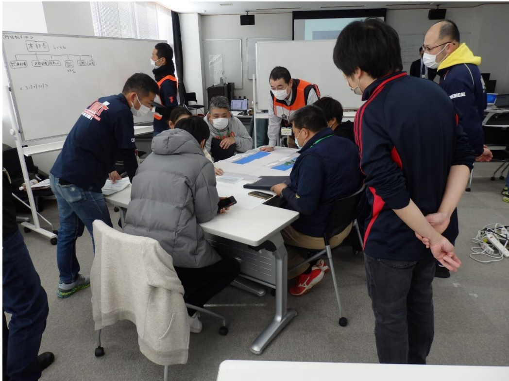
講義5 「実習 病院支援と受援」