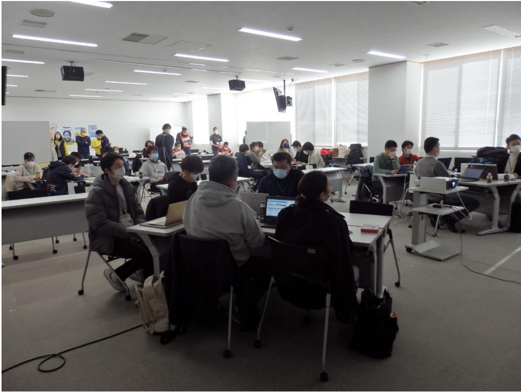
講義4 「実習 広域災害救急医療情報システム (EMIS)」