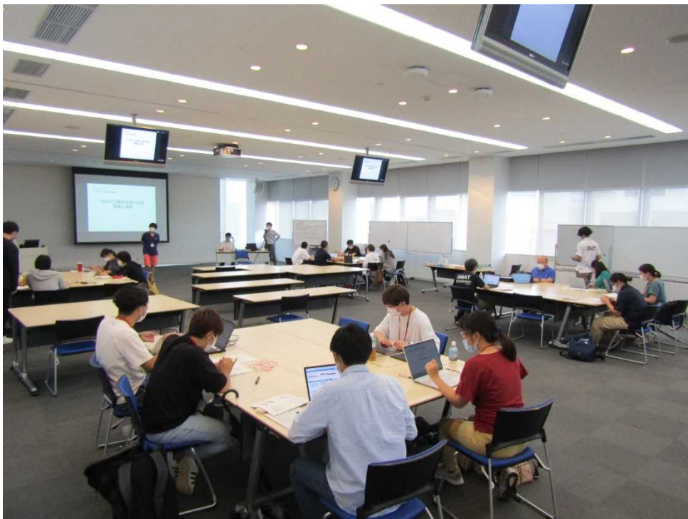
講義5 「実習 病院支援と受援」①