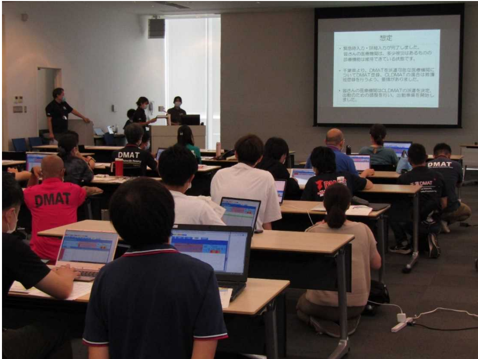
講義4 「実習 広域災害救急医療情報システム(EMIS)」