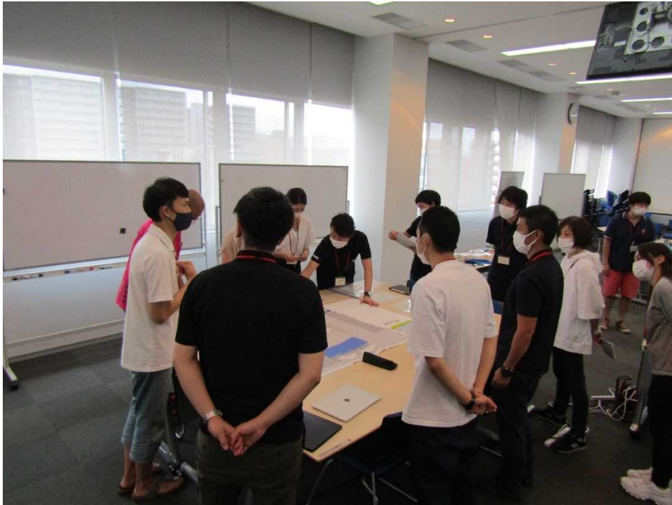
講義5 「実習 病院支援と受援」②