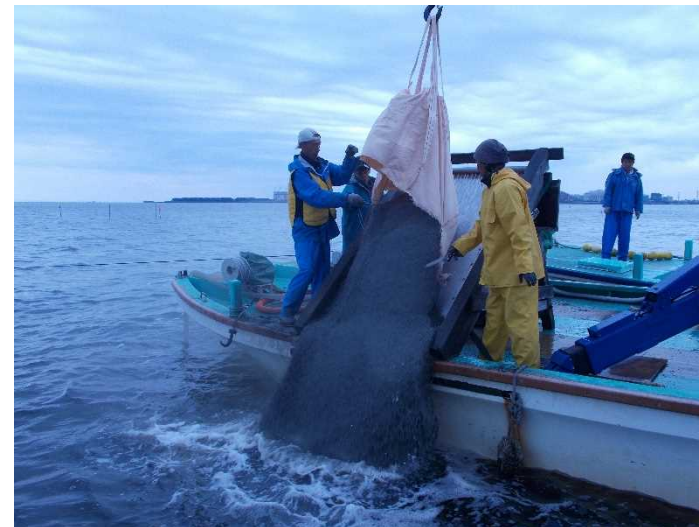
図 2 客土 (碎石覆砂) 実施状況 (船橋市漁業協同組合活動グループ)