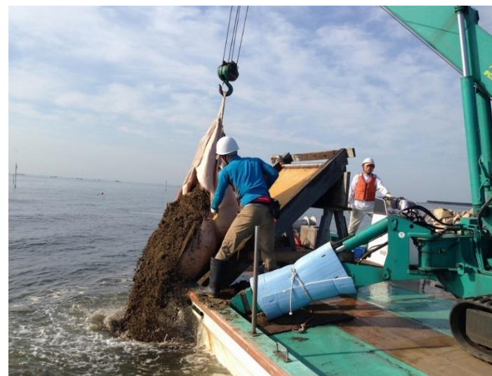
図 2 客土実施状況（船橋市漁業協同組合活動グループ）