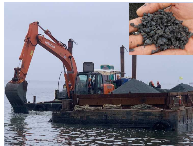
図2 客土（碎石覆砂）実施状況（船橋市漁業協同組合活動グループ）