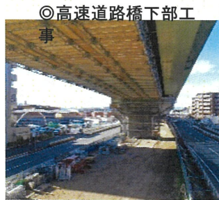
◎高速道路橋下部工事