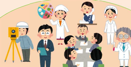
県では、県民のみなさんのため、いろいろな仕事をしています。