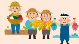
農林水産業をさかんにする