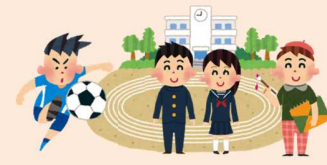
教育・文化・スポーツをさかんにする