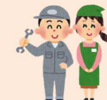
商業・工業をさかんにする