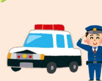
地域の安全を守る