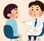
みんなの健康を守る