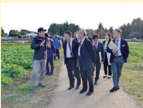
農園リゾートとしての取り組みについて説明を受ける委員

グランピング施設を中心に農作物の収穫体験や温泉施設等を併設した「農園リゾートTHE FARM」の運営およびフランチャイズ事業の運営等について調査しました。