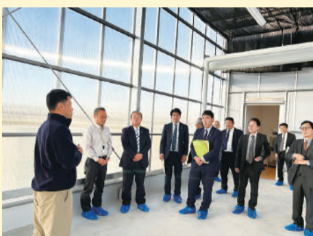
果物・野菜の品種開発等を行うための新設のハイテクハウスについて説明を受ける委員

日本の気候に適したトマト、キュウリ、レタス等の新品種開発等の取り組みについて説明を受け、その後、環境制御が可能なハイテクハウスやデモほ場について視察しました。