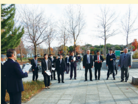
官民連携により出店したカフェの説明を受ける委員

県立柏の葉公園で官民連携によりオープンしたカフェとパーベキュー場の調査をしました。その後、柏北部中央地区土地区画整理事業の状況を視察しました。