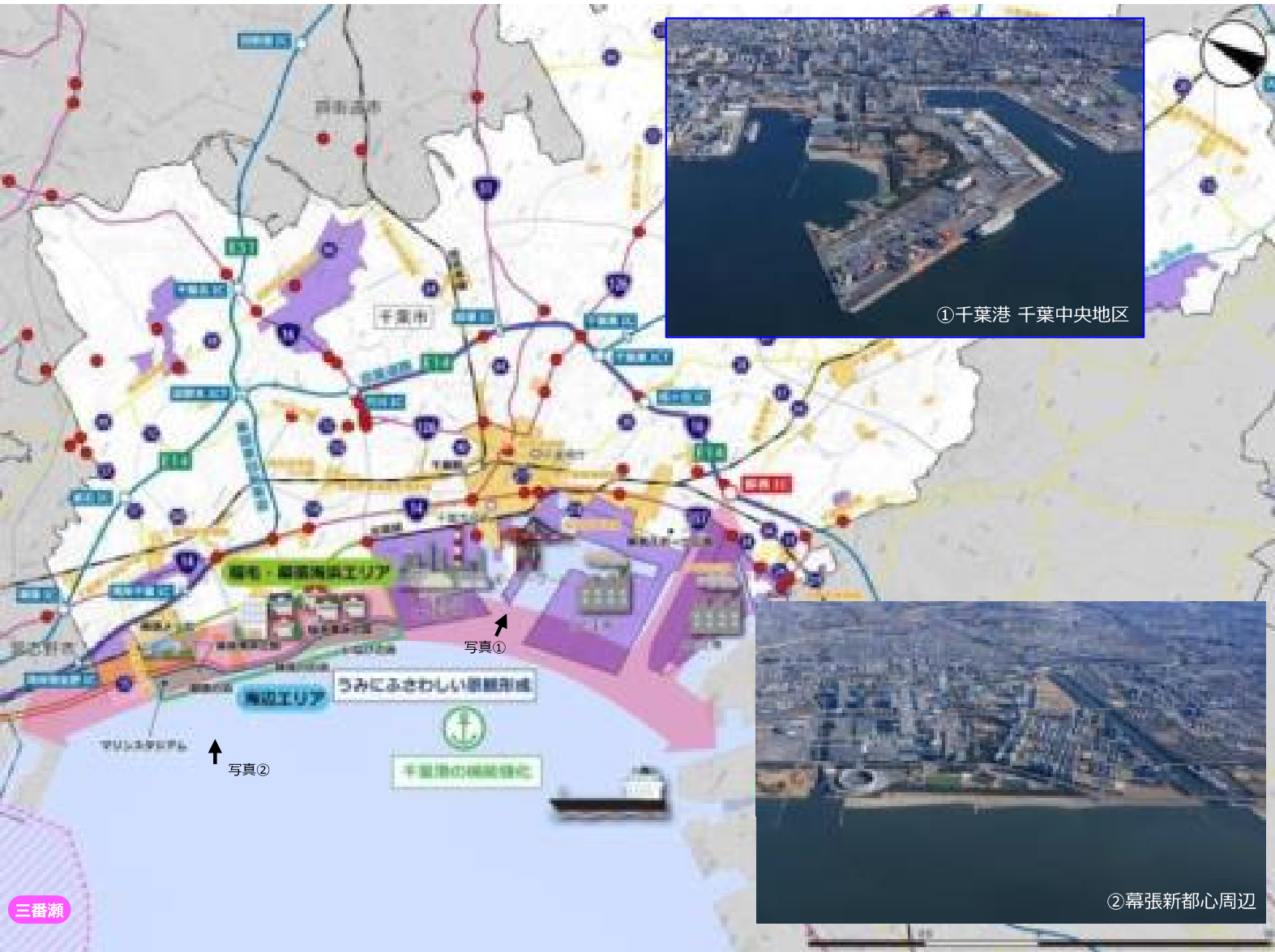
①千葉港 千葉中央地区