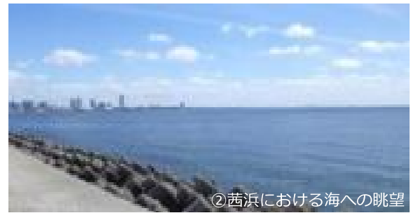
②茜浜における海への眺望