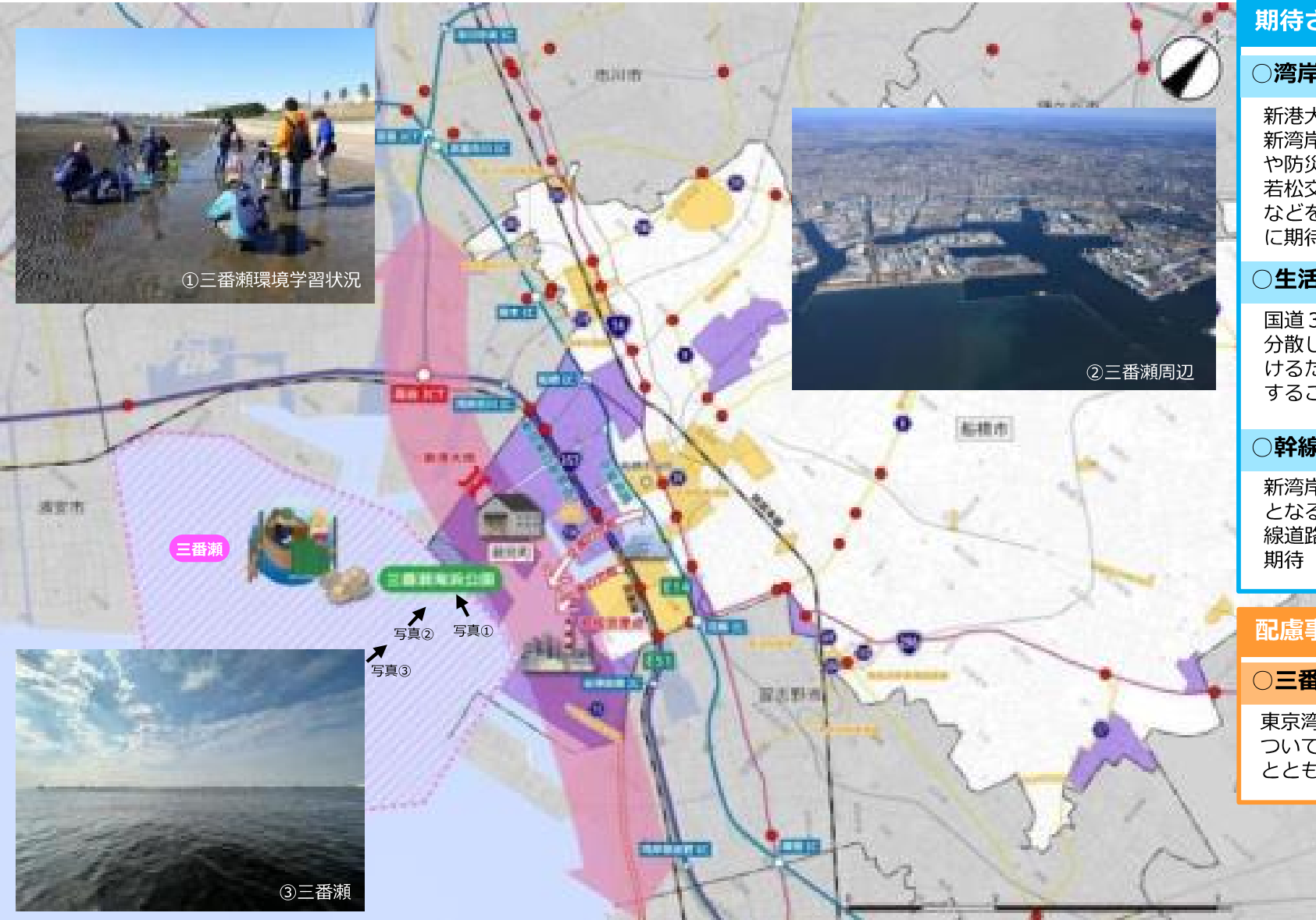
①三番瀬環境学習状況

東京湾奥部に残された貴重な干潟となる三番瀬について、千葉県三番瀬再生計画との整合性を図るとともに、地域の生活環境に配慮