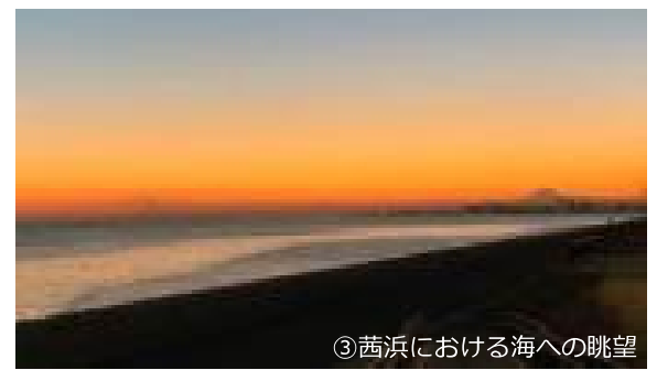
③茜浜における海への眺望