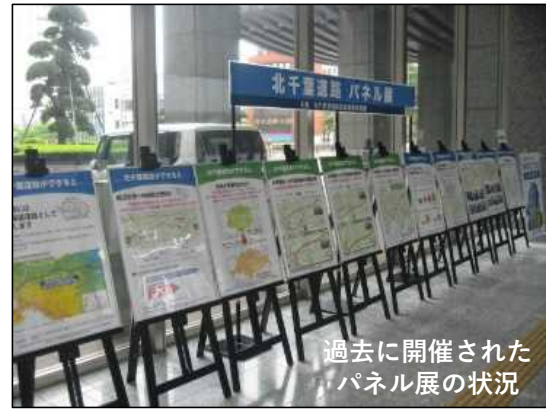
過去に開催されたパネル展の状況

・なお、パネル展の内容はどの会場も同じですので、ご都合のよい日時、場所にお立ち寄りください。