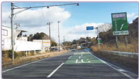
2 緑色のカラー舗装が見えてきたら、まもなく右側に分岐