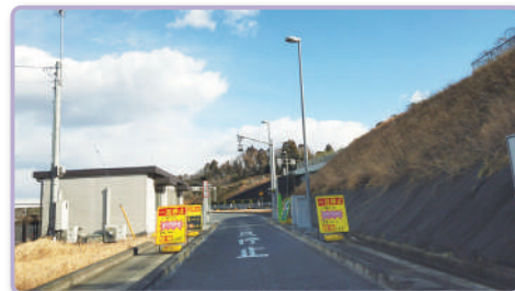
3 ゲートの手前で必ず一旦停止