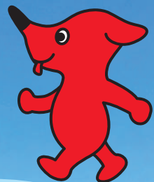
千葉県 マスコットキャラクター チーパくん