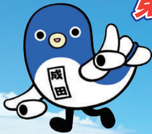
成田市 観光キャラクター うなりくん ©成田市2009