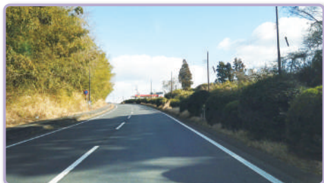
1 成田スマートIC利用時は右車線を走行