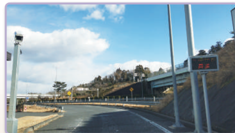
4 ゲートが開いたら、直進して新空港自動車道に合流