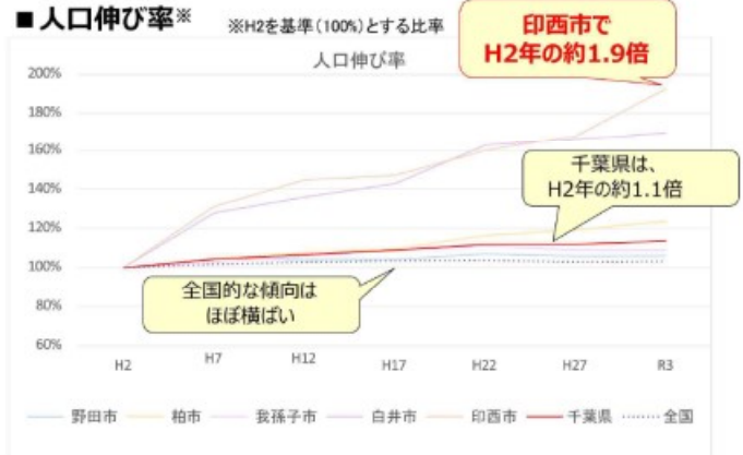
図 千葉県北西地域の人口の伸び率

印西市は「全国住みよさランキング(東洋経済新報社)」において2012年から2018年の間、7年連続で全国総合1位を獲得。