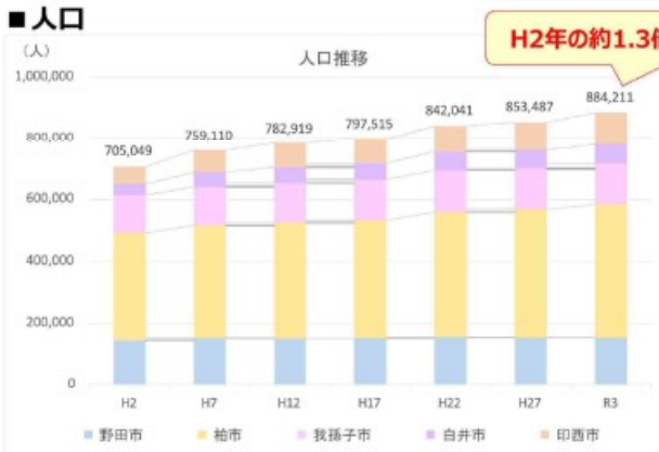
図 千葉県北西地域の人口推移