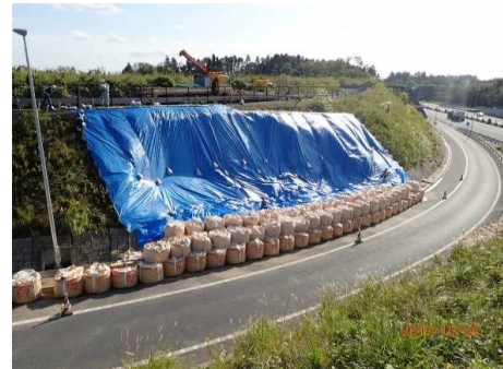
現況(応急復旧対応)