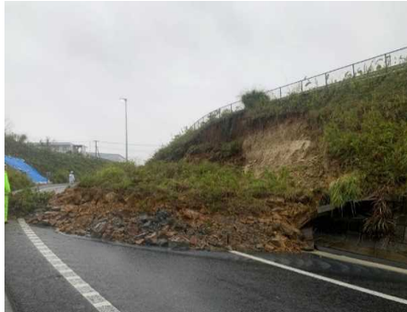
被災状況(令和元年10月25日)

工事実施にあたっては、ランプを閉鎖して作業を行う必要があります。そのため、道路利用者へ極力ご迷惑をおかけしないよう、交通量が少ない夜間にランプを閉鎖し行います。安全・快適に高速道路をご利用いただくために必要な工事ですので、ご理解とご協力をお願い致します。