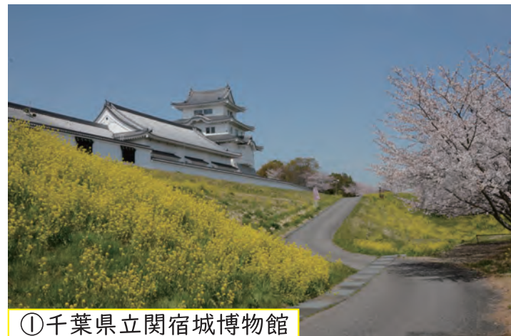
①千葉県立関宿城博物館

この博物館は「河川とそれにかかわる産業」をテーマとした全国でも珍しい川の歴史・民俗を専門として、展示しています。利根川・江戸川の歴史や文化を、河川交通と伝統産業の面や治水・洪水の面から紹介し、博物館2階の天守閣では、近世の関宿藩についての展示を行っています。 また、4階の展望室からは、利根川の流れや関東一円の山並みを一望することができます。 野田市関宿三軒家143-4 TEL 04-7196-1400 FAX 04-7196-3737