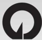
「里山の景観を守り昔ながらの市民農園」