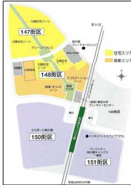
【147街区 148街区 位置図】