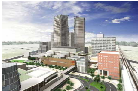
147街区で建築中のマンション

建築が進んでいるマンションにつきましては、平成22年4月に一部の棟の竣工予定を初めとし平成24年4月にはすべての棟が竣工する予定です。そして隣接する148街区においては、商業施設、オフィスビル、ホテル、賃貸マンションなどが平成24年度の完成を目指して建設されます。