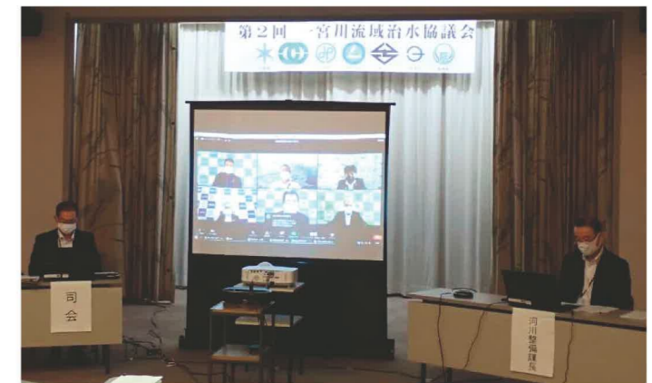
第2回一宮川流域治水協議会の様子

県が行う河川整備や、市町村が行う流域対策の実施状況を共有したうえで、以下3点について合意しました。