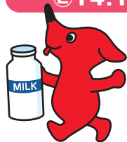
千葉県マスコットキャラクター「チーバくん」

① 11:45 ~ 12:15 (6/1) 11:15 ~ 11:45 (6/2) ② 13:45 ~ 14:15