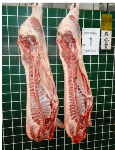
名誉賞の枝肉（雌、去勢）