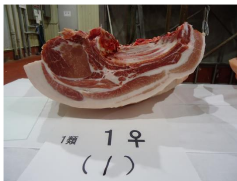
と カット面（第4-5胸椎間）