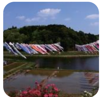
いきいきやまだ 鯉のぼりまつり