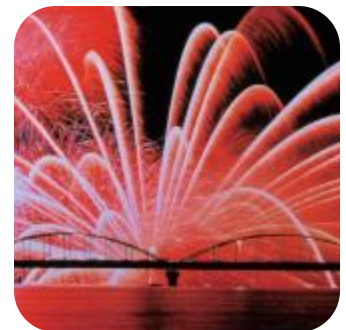
水郷おみがわ花火大会