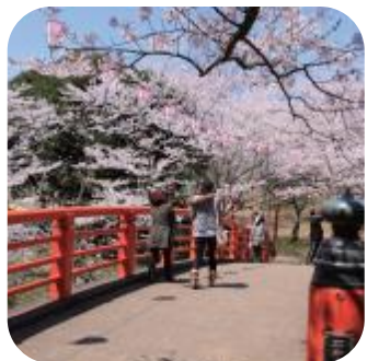
水郷おみがわ桜つつじまつり