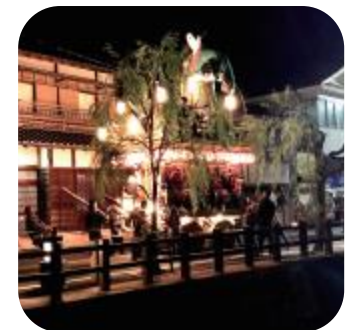
佐原の大祭秋祭り