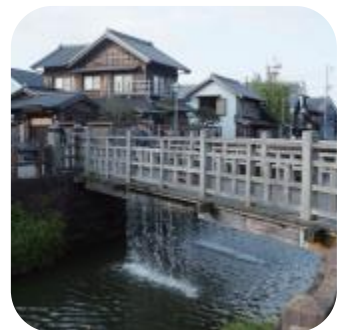
小野川じゃあじゃあ橋(極橋)