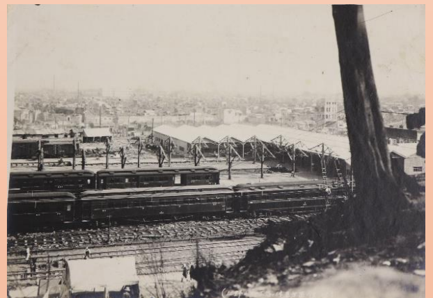
〔写真 上野駅より下谷浅草方面の遠望〕 富樫家文書ア8(21)