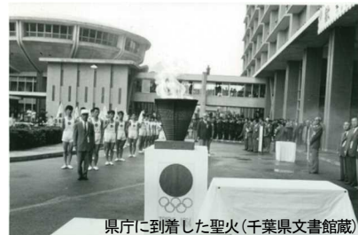
県庁に到着した聖火