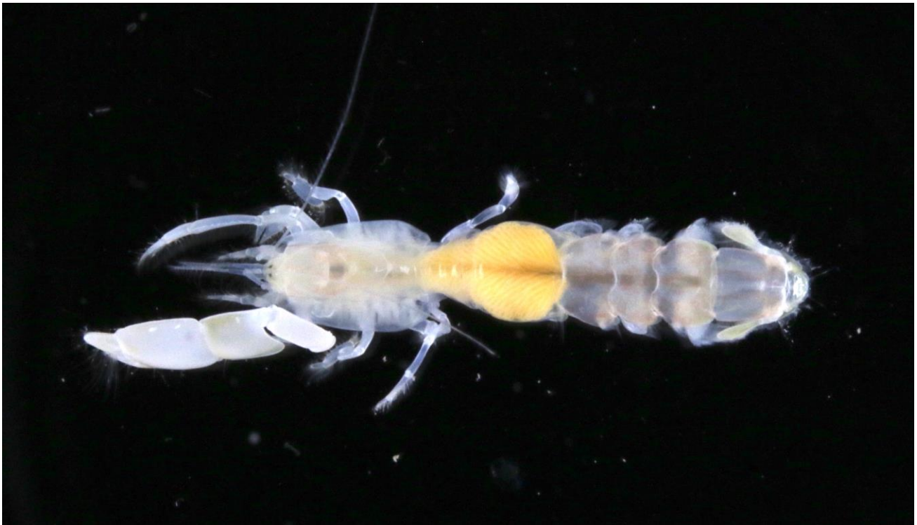
写真：新種として記載した「ワカサスナモグリ Callianassa ogurai 」

本成果は、2022年9月8日（現地時刻）にニュージーランドの国際学術誌「Zootaxa」にオンライン掲載されました。