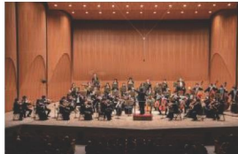
千葉交響楽団® 金瀬 胖