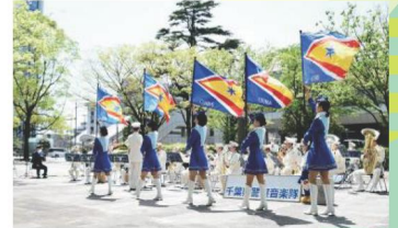
県警音楽隊・カラーガード隊