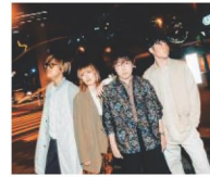
リトロリロン ※映像出演

ROCK IN JAPAN FESTIVAL 2022 等に出演したバンドらによるライブ! スペシャルゲストも登場!