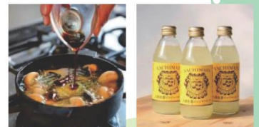
千葉の魅力発見コーナー