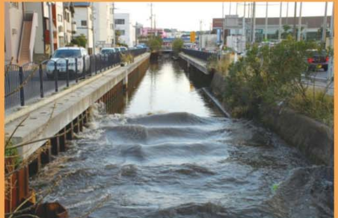
水路を遡上する津波 (銚子市)