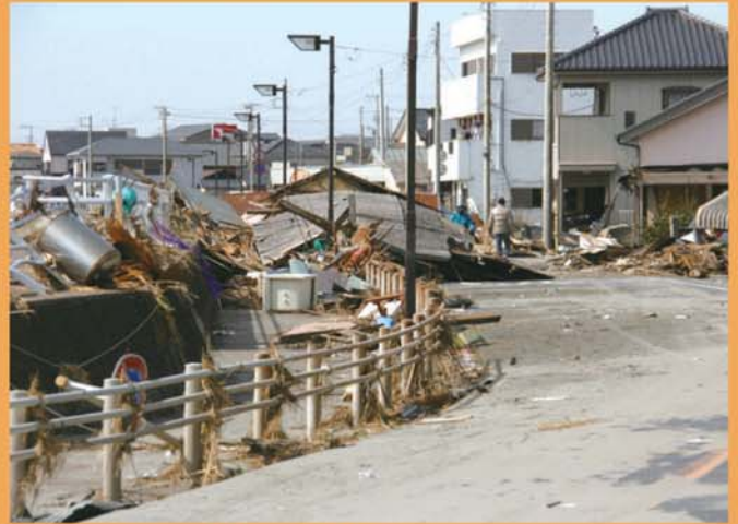
津波による被害 (旭市飯岡)