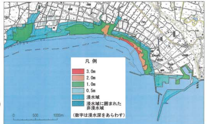
旭市周辺の浸水状況