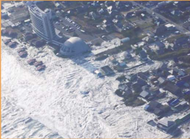
押し寄せる津波 (旭市沿岸)