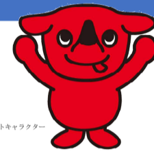
千葉県マスコットキャラクター「チーバくん」