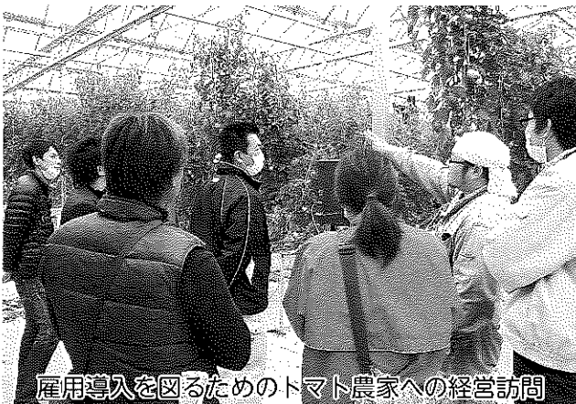
雇用導入を図るためのトマト農家への経営訪問