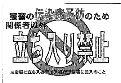
衛生管理区域の立て看板

消毒薬が汚れた場合は、すぐに交換しましょう。また、汚れていなくても定期的な交換、散布をする必要があります。