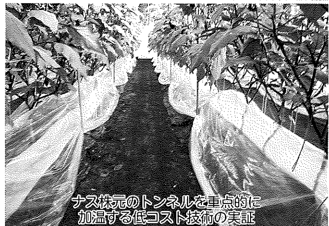
ナス株元のトンネルを重点的に 加温する低コスト技術の実証

山武地域には、多様な野菜品目で県内屈指の産地が形成されています。農業事務所では代表的な品目であるネギ、ニンジン、トウモロコシといった露地野菜、トマト、キュウリ、ナスといった施設野菜の産地強化を目指して、重点的な支援活動を展開しています。 ネギは、物量と安定した出荷が単価の確保につながるため、集出荷センターを活用した産地の維持・発展を図っています。夏どりや秋どりの安定生産による作期拡大、経営規模拡大を支える省力技術等の導入を推進しています。 秋冬ニンジン主体の産地では、持続的な農業の発展と農家の所得向上を図ります。スイカに加え、春ニンジンを中心とした新規品目の導入による輪作体系を確立していきます。 トマト、キュウリ、ナスなどの施設果菜類では、病害虫や燃油等のコスト高騰が問題となつていきます。ウイルス病等の防除が難しい病害虫の適正防除を行うとともに、低コスト技術の導入や労力確保に向けた取組を進めています。