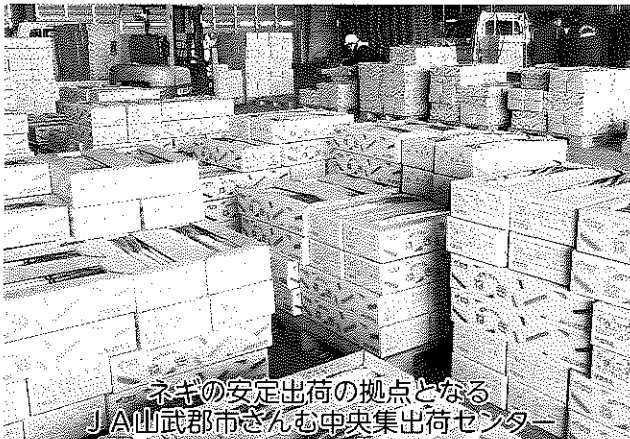
ネギの安定出荷の拠点となる JA山武都市さんむ中央集出荷センター