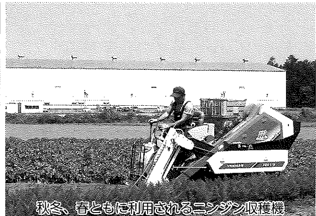
秋冬、春ともに利用されるニンジン収穫機