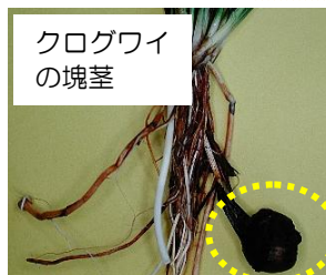
クログワイの塊茎