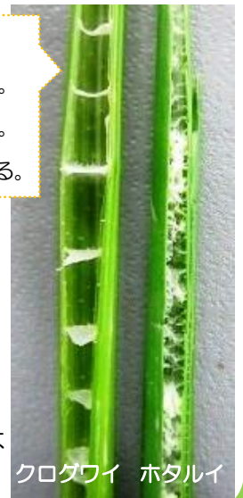
クログワイ ホタルイ

その他に、発生はクログワイは塊茎、ホタルイは種子であることや、花の位置がクログワイは先端、ホタルイは葉の途中であることでも見分けられます。