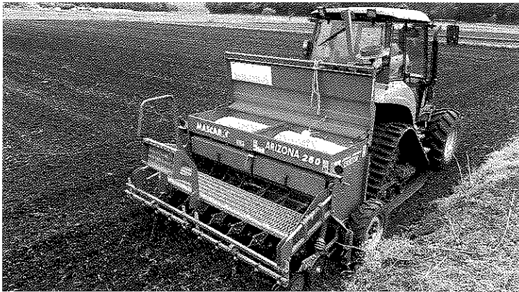
直播機で乾籾を播種します

〒285-0026 佐倉市鍋木仲田町8-1 TEL: 043-483-1124 FAX: 043-485-9502 ホームページアドレス http://www.pref.chiba.lg.jp/ap-inba/inba/mokuji/index.html 発行: 印旛農業事務所改良普及課・印旛地域農林業振興普及協議会