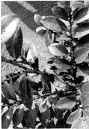
ヒサカキの被害状況

その他、枝や幹に付着しているカイガラムシを、ヘラやブラシを使ってこすり落としましょう。さらに、可能であれば、密に発生している箇所を剪定してしまうのも一つの方法です。防除の後もし生き残った個体があった場合、再び多発生してきますので、防除後の経過観察も重要です。