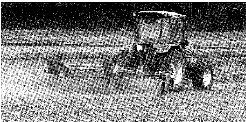
播種後はケンブリッジローラーで鎮圧します

佐倉市では、コントラクター 組織(は種や収穫作業を請け負 う組織)によってWCS用稲の 乾田直播が行われ、団地化が図 られています。コントラクター を中心に、栽培開始前に研修会 栽培期間中には、畜産農家・関 係機関と合同巡回を行い、排水 状態の確認や、刈り取り適期の 判断について目合わせを行いま す。また、耕畜双方の需給見込 みを確認し、耕畜連携の体制を 整えています。