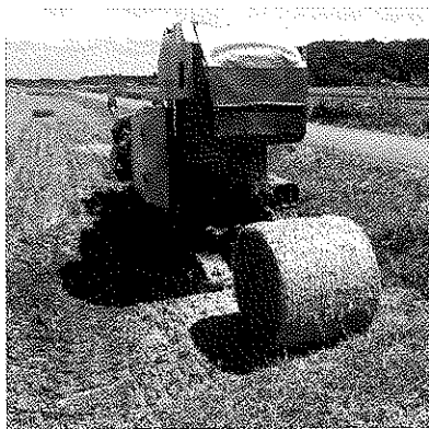
稲WCSの専用収穫機による収穫風景

茎葉を含めた稲の全体を収穫し、サイレージ化した家畜用の飼料を言います。稲作農家にとっては収穫・乾燥作業がいらないため、省力化できる水田の転作作物として、広く栽培されています。栽培には主にコシヒカリ等の主食用の品種が用いられていますが、一部の畜産農家からは、稲WCS専用品種（茎葉型）が求められています。