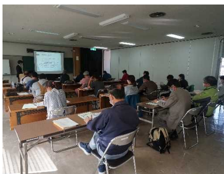
食用ナバナ経営力強化研修