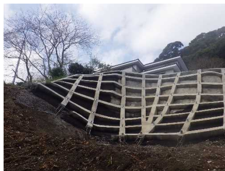
地すべり対策工事（県単奥山地区）