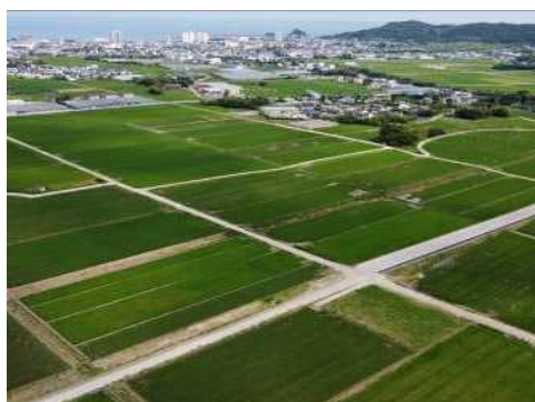
令和3年度からほ場整備後の耕作が 始まった加茂川中部地区