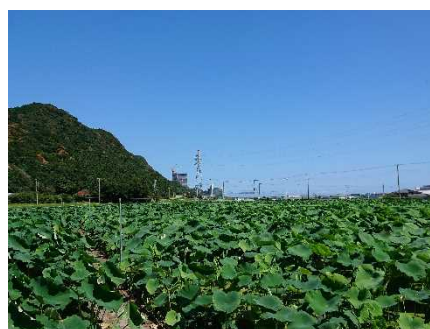
れんこん栽培ほ場（鴨川市）