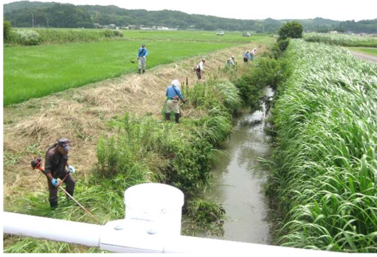
地域資源の保全活動