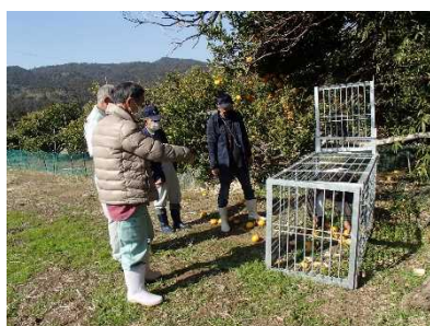
地域ぐるみの被害防止対策