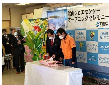
「館山ジビエセンター」 オープニングセレモニー