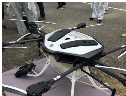
栽培講習会での農薬散布用ドローンの紹介