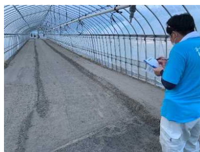
農業者による被害防止チェック活動