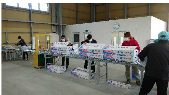
新しく集出荷場を整備した農協共選