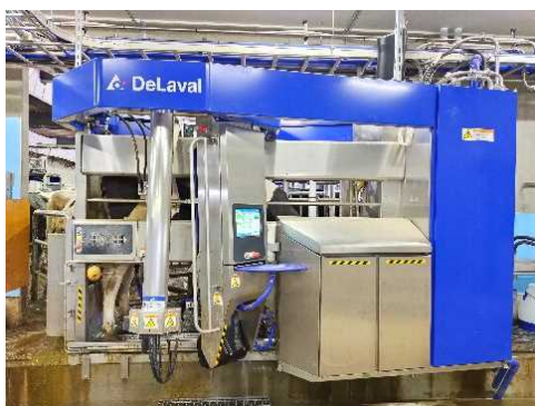
省力化機械導入事例（搾乳ロボット）