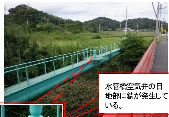
水管橋（佐久間地区）