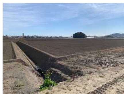
区画整理工事 (加茂川中部地区)