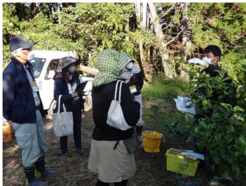
アグリサポーターセミナー (レモン収穫)