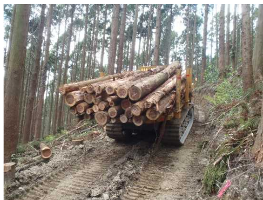
高性能林業機械による間伐材の搬出