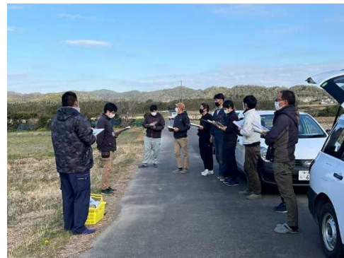
農業経営体育成セミナー (相互訪問研修)