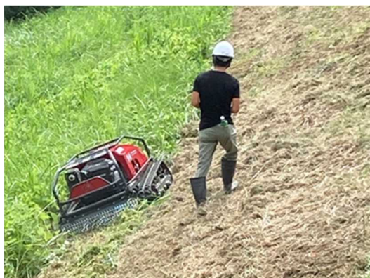
ラジコン草刈機による農業用堰土手の除草作業実演