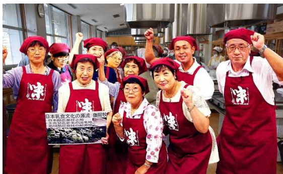
プロジェクト鴨川味の方舟（鴨川市）