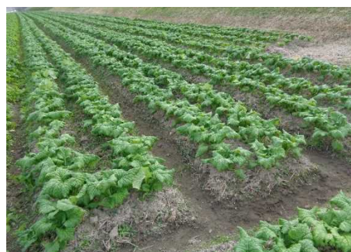
代表的な転作品目の1つである食用ナバナ