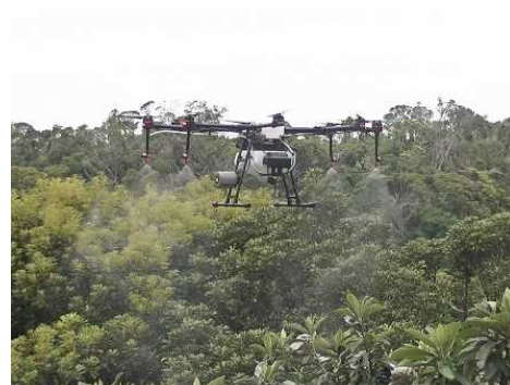
空中散布用ドローンによる防除試験