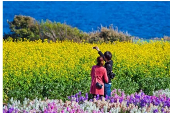
写真コンクール入選作品