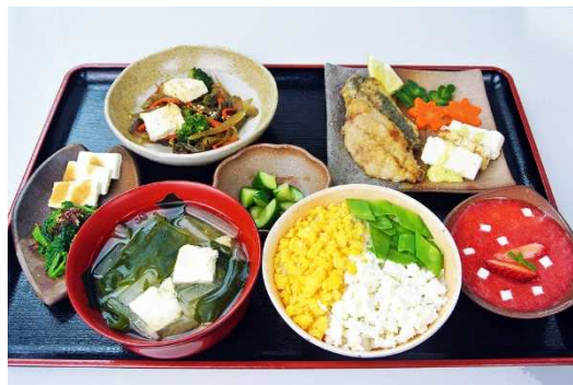
チッコカタメターノ和善（郷土食）