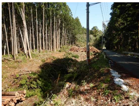
災害に強い森づくり事業