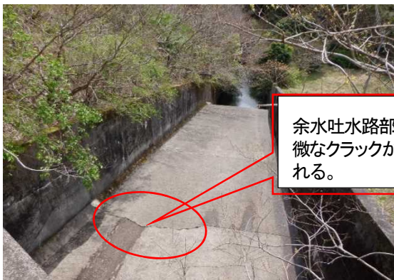
金山ダム余水吐（加茂川左岸地区）

※基幹水利施設：国営または県営土地改良事業により造成された受益100ha以上の農業水利施設