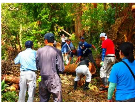
台風被害から農道復旧に取り組むびわ生産者