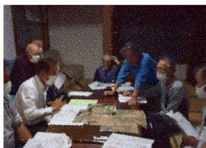
中間管理事業、「人・農地プラン」の担い手検討会、説明会の様子