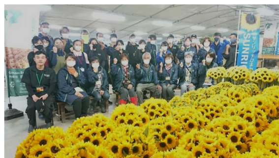
多くの雇用を抱える法人経営