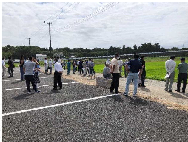
粒すけ栽培現地検討会