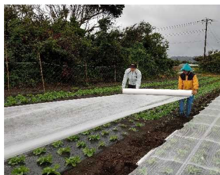
レタスべたがけ栽培