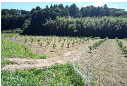
次世代人材投資事業を活用した新規参入者による 荒廃農地の解消事例 (果樹)