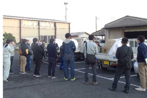
稲WCS生産・利用推進研修会