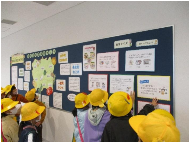
(掲示資料を見る子どもたち)

事業主体：茂原市学校給食センター 日にち：2022年11月 場所：学校給食センター内 市内各小中学校