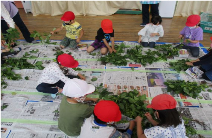
枝豆の枝もぎの様子