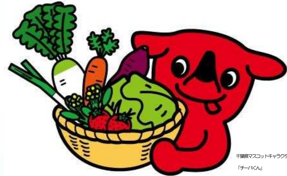
千葉県マスコットキャラクター「チーバくん」

「ちばの恵み」を取り入れたバランスのよい食生活の実践による生涯健康で心豊かな人づくり