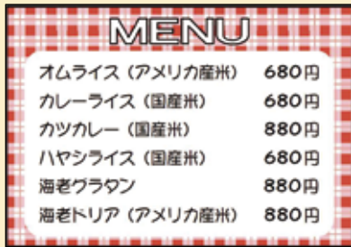
〔例1〕メニューへ表記

米飯類 (注3) を提供する際には、 お米の産地情報の伝達 が必要です。 伝達方法はお店の実情に合わせて選べます。