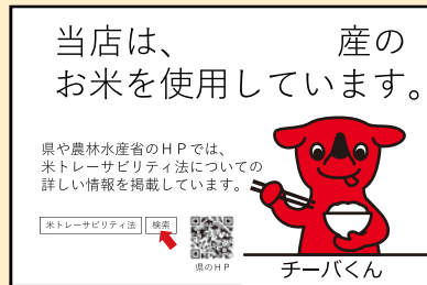
〔例2〕店内掲示で伝達