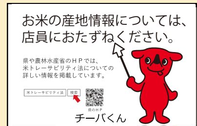
〔例3〕店員が産地情報伝達