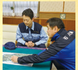
馳石川県知事との面談 (石川県庁)

※対口支援…被災自治体ごとにパートナーとなる支援自治体を割り当てて支援をする手法