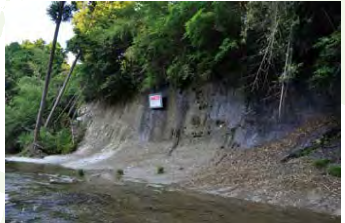
ชิบาเนียน (ยุค) (เมืองอิชิฮาระ) チバニアン(期) (市原市)

※GSSP = Global Boundary Stratotype Section and Point