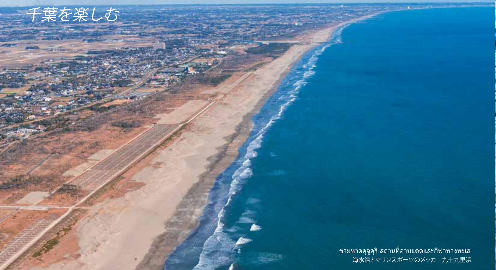
ชายหาดคัจจูกูริ สถานที่อาบแดดและกีฬาทางทะเล 海水浴とマリンスポーツのメッカ 九十九里浜

จังหวัดจิบะมีอากาศอบอุ่นแม้ในฤดูหนาว และฤดูใบไม้ผลิมาเยือนค่อนข้างเร็ว เมื่อเข้าเดือนกุมภาพันธ์ ดอกไม้ที่มีสีสันสดใส เช่น ดอกกะโนะฮานะ เริ่มผลิบานในแต่ละพื้นที่ เมื่อเข้าฤดูร้อน ดอกไอริสชื่อฮานะโซบุ ซึ่งมีสีสดจะเบ่งบานเต็มสวน