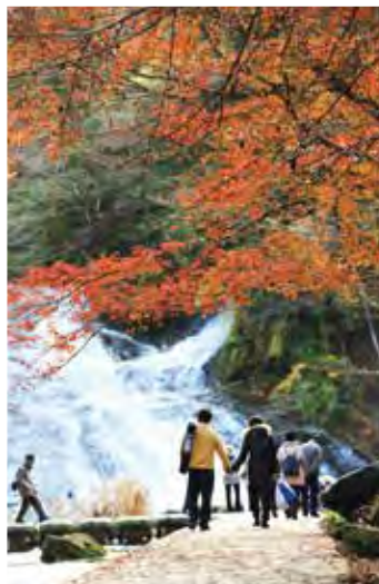
หุบเขาโยโรเป็นสถานที่เลื่องชื่อเรื่องทัศนียภาพที่งดงาม ท่านสามารถเดินเล่นและชมใบไม้เปลี่ยนสี (เมืองอิิจิฮาระ เขตโอคิตะ) 紅葉を眺めながら散歩できる名勝、養老渓谷 (市原市・大多喜町)