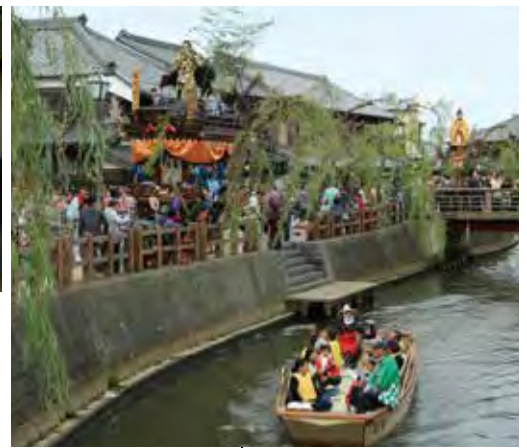
บริเวณอนุรักษ์สิ่งก่อสร้างทางวัฒนธรรมของสะวาระ เมืองคาโทริ (เมืองโซชิ) 香取市佐原伝統的建造物群保存地区 (香取市)

北総四都市は、4つの性格の異なる町が、それぞれ特色のある独自の発展を遂げ、今も変わらない江戸時代からの町並みや祭礼などの伝統文化が受け継がれています。