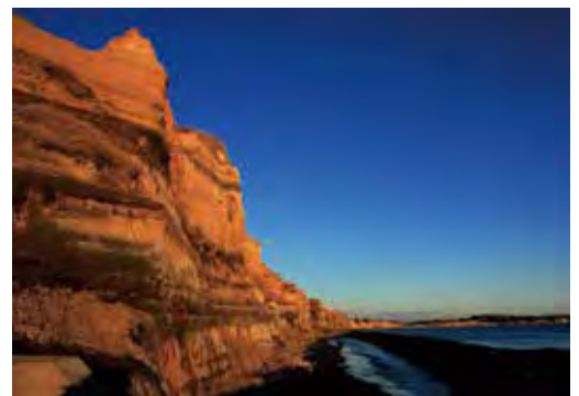
เบียวาบุกะอุระ ภูมิทัศน์ขึ้นชื่อของประเทศ และ อนุสรณ์สถานทางธรรมชาติ (เมืองโซชิ) 国名勝及び天然記念物屏風ヶ浦 (銚子市)