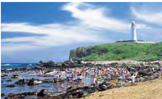
ประกาศารอิโนุโซากิ (เมืองโซชิ) 犬吠埼灯台(銚子市)