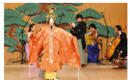
“โนกาคุ”ดนตรีบรรเลงสี่ชิ้น” ณ หอศิลปะและวัฒนธรรมอาโอบะโนะโมริ 「能楽∞四重奏」青葉の森芸術文化ホール