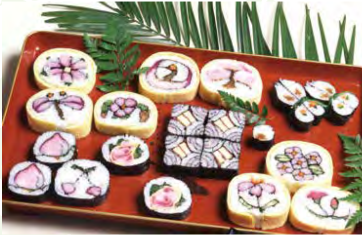
ฟูโตมาคิ มัตซึริ ซูชิ 太巻き祭り寿司