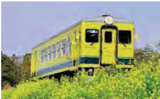
รถไฟสายอิซุมิเป็นรถไฟท้องถิ่นที่วิ่งผ่านเมืองอิซุมิและเขตโอคิตะในคาบสมุทรโบโซ 房総半島のいすみ市・大多喜町を走るローカル線・いすみ鉄道