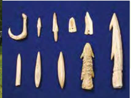
เครื่องใช้จากเขาสัตว์ที่ขุดพบ 出土した骨角器

ซากกอกเปลือกหอยขนาดใหญ่ที่สุดแห่งหนึ่งในญี่ปุ่น (โบราณสถานพิเศษคะโซริโคจิกะ) 日本最大級の貝塚(特別史跡加曾利貝塚)