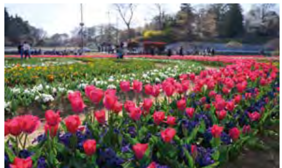
สวนเกษตรอาเคโบโนะ มีดอกทิวลิปเบ่งบานมากกว่า 1.6 แสนดอก (เมืองคาชิวะ) 16万球のチューリップが咲き誇る、あけぼの山農業公園(柏市)