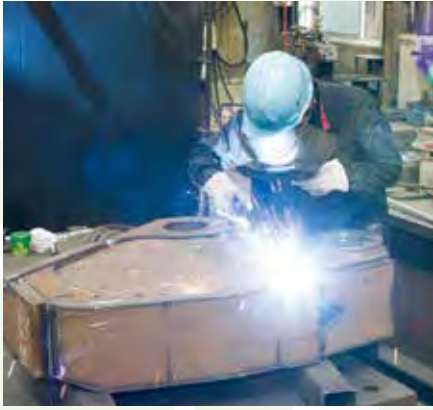
แสงสว่างจากเทคโนโลยีที่เชี่ยวชาญ 熟練した技術が光ります