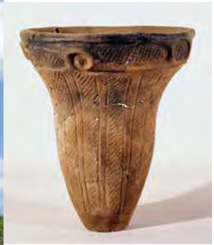
เครื่องปั้นดินเผาโคมองที่ขุดพบ 出土した縄文土器