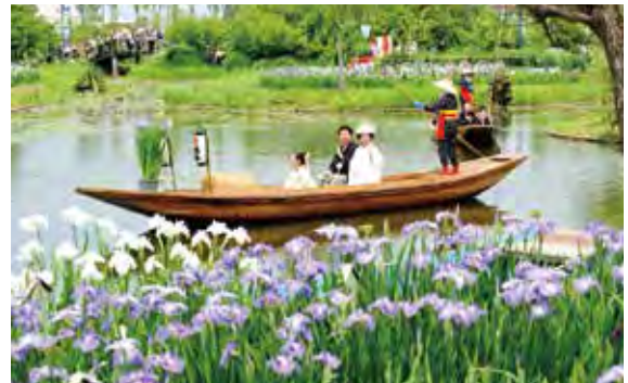
สวนดอกไอริสชุยโกสะวาระ (เมืองคะโทริ) 水郷佐原あやめパーク(香取市)