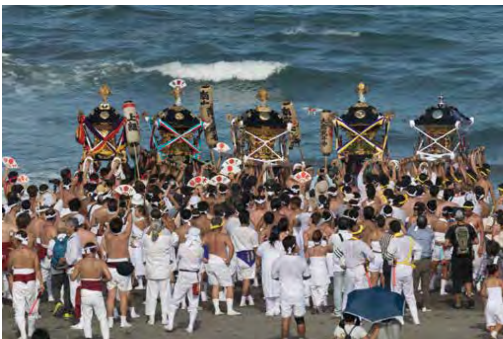
เทศกาลโจโซจิเบะ (เมืองอิชิโนะมิยะ) 上総十二社祭り(一宮町)

「千葉交響楽団」は、本県を代表するプロオーケストラです。クラシック曲のほか、日本の伝統芸能「能楽」と共演するなど、オーケストラの新たな魅力づくりに挑戦しています。