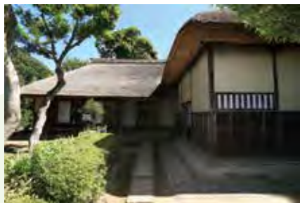
บ้านซามูไร (เมืองสะคุระ) 武家屋敷 (佐倉市)

เมืองทั้งสี่แห่งในบริเวณโฮคุไซ ส่วนมีบรรยากาศที่แตกต่างกับทั้งสี่เมือง โดยแต่ละเมืองได้เจริญขึ้นมาด้วยเอกลักษณ์เฉพาะตัว และมีสภาพบ้านเมืองที่ไม่เปลี่ยนแปลงมากนักจากสมัยเอโดะ รวมทั้งได้สืบทอดวัฒนธรรม เช่น งานเทศกาลต่างๆ ต่อเนื่องมาจนถึงปัจจุบัน