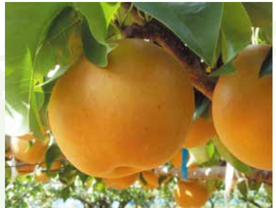
"อาภิมิตสึกิ" สาลี่ใหม่แห่งจิบะ ちばの新しい梨「秋満月」

江戸時代には、江戸に隣接していることから「江戸の台所」と呼ばれていた千葉県。日本の酪農の発祥の地でもあります。新鮮な食材は健康の源。成田空港から、千葉の高品質で安全・安心な農林水産物を世界にお届けします。