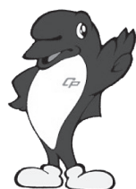
千葉県警察マスコットキャラクター シーポック