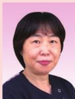
訪問看護ステーションさわら看護師長

スタッフも大切な仲間です。 お互いを尊重し認め合うことで、 自信をもって訪問に行くことができます。