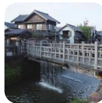
小野川じゃあじゃあ橋(樋橋)