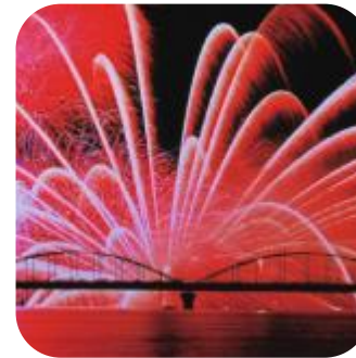
水郷おみがわ花火大会