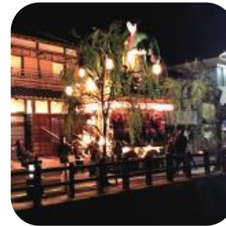
佐原の大祭秋祭り