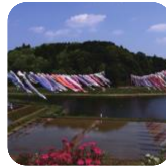
いきいきやまだ 鯉のぼりまつり