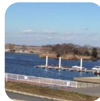
道の駅 水の郷さわら