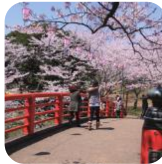
水郷おみがわ桜つつしまつり