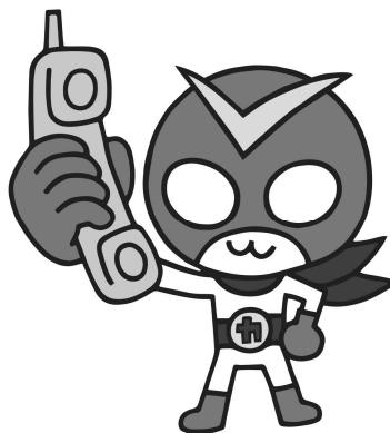
「確認戦士カクニンダー」