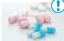
医薬品の多量摂取