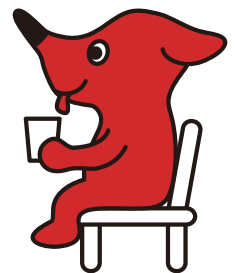
千葉県マスコットキャラクター 「チーバくん」