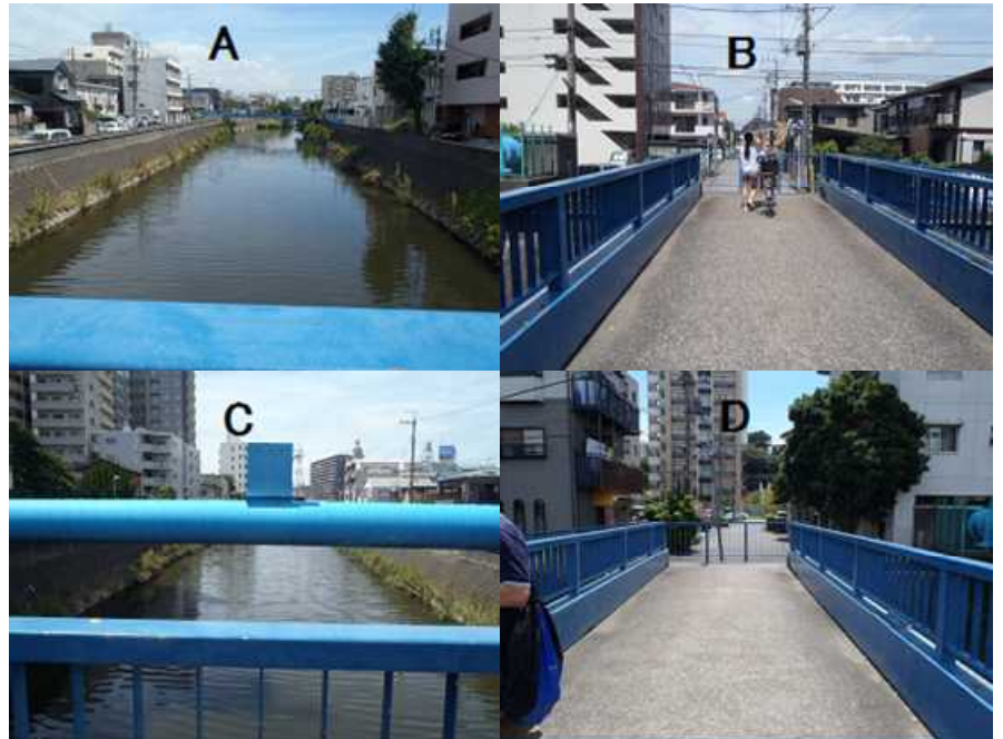
測定地点情報：松戸市 (N 35° 47' 23" , E 139° 54' 04" )

<千葉県版指標*)による調査日の水質データ> (簡易 pH メータ及び電気伝導度計使用による)