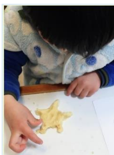
県内だけでなく、県外の こどもエコクラブメンバー も参加しているよ