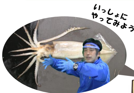
「生きもののしくみを知ろう イカ」では 教えてもらいながら、一緒にイカの生態を調べたよ