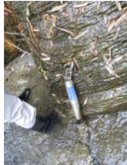
図2 連続モニタリング地点