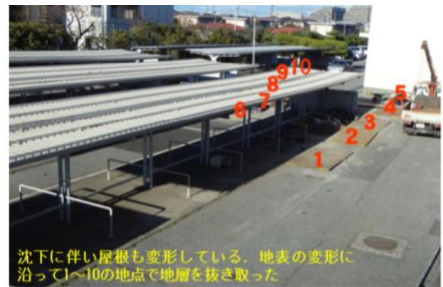
図 1 地震時の液状化一流動化により局所的に沈下した自転車置き場