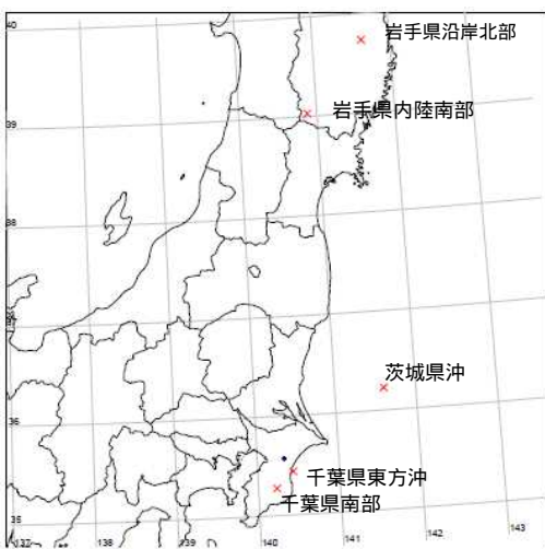
図1 対象とした地震の震源(x)