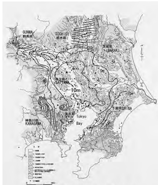
図2 関東地下水盆の地下水位図 2003年(平成15年)7月