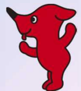
千葉県PR マスコットキャラクター 「チーバくん」

流山グリーンチェーン戦略：流山市では、平成18年より開発でいったん減少した緑を回復させ、緑豊かな環境をつくる戦略を展開。「緑の連鎖」による環境価値の高いまちづくりを推進し「都心から一番近い森のまち」として選ばれる街を目指している。